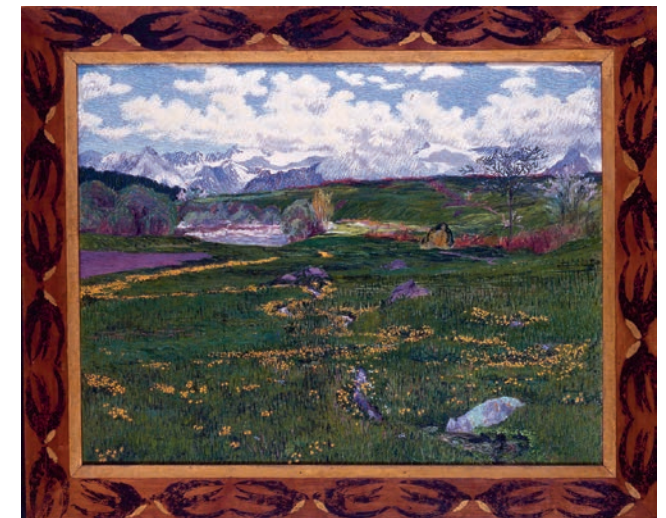
Giovanni Giacometti Primavera